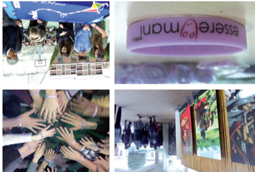
EVENTI E MOSTRE SU VARIE TEMATICHE ORGANIZZATE DA DOCENTI E ALUNNI